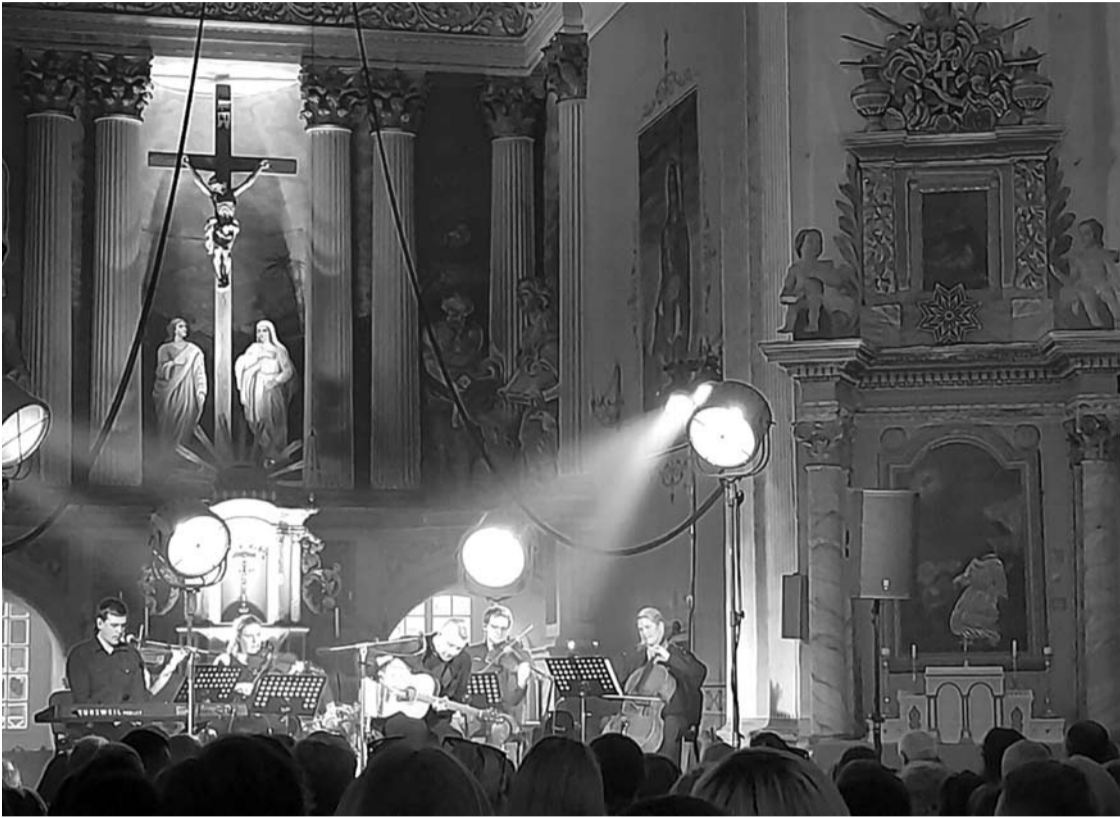
Akimirka iš birželio 8-ąją vykusio koncerto Troškūnų Švč. Trejybės bažnyčioje.

Birželio 7–11 dienomis Troškūnuose ir Anykščiuose vyksta 22-oji tarptautinė jaunimo edukacinė stovykla – festivalis „Troškimai“.