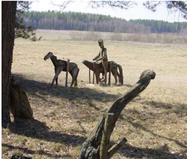
Butėnų palauke keliauja riteris Don Kichotas...